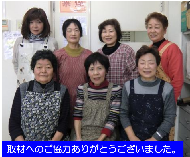
取材へのご協力ありがとうございました。

代表者へメッセージをお願い致します! ◆これからも宜しくお願いします。◆これからも愛陶会を継続 する為、尽力お願い致します。◆色々と気を使ってくれて助か ります。