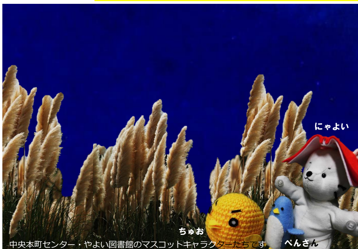
中央本町センター・やよい図書館のマスコットキャラクターたちです

中央本町地域学習センター・やよい図書館の ソーシャルメディアでうれしい情報をゲット！