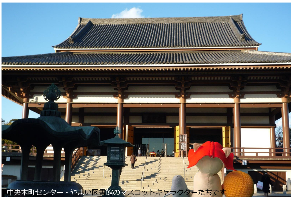
中央本町センター・やよい図書館のマスコットキャラクターたちです

中央本町地域学習センター・やよい図書館の ソーシャルメディアでうれしい情報をゲット！